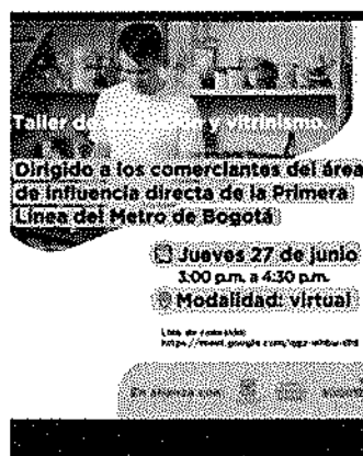
Figura No. 1 Invitación Taller

El taller se llevó a cabo el 27 de junio de 2024, con la participación 14 comerciantes.